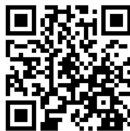
八千代市立図書館