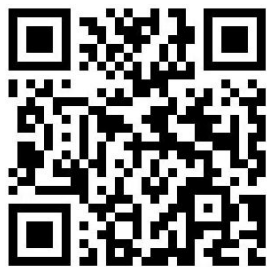
TRC八千代中央 図書館