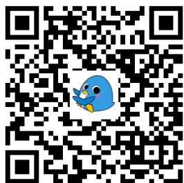
TRC八千代中央図書館 緑が丘図書館 勝田台図書館 オーエンス市民ギャラリー