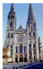
シャルトル大聖堂