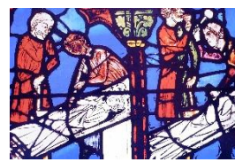
ステンドグラス (シャルトル大聖堂)