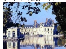
フォンテーヌブロー宮殿