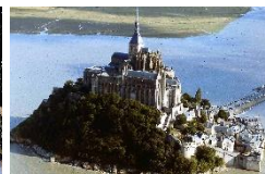
モン・サン=ミッシェル