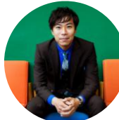
講師 アートテラーとに~

市民ギャラリー 第4展示室 講師 アートテラーとに~ 対象 小学3年生以上 / 定員 18名(要予約) 参加費 無料 / 持ち物 特になし