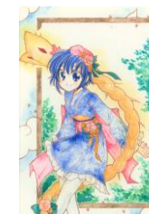
高野空&ツジ美(上高野の 辻切り)作:高月美舞

※例年開催していた ギャラリートークは 新型コロナウイルス 感染拡大予防のため 中止とさせて頂いた できます。