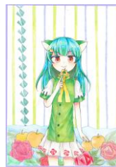
ちゃこ(新川・梨・バラ) 作:ししゃも