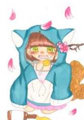
やっちゃん(やっち・桜・ らっかせい)作:モフトラ