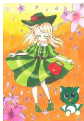
緑 八千子 (やっち・つつじ) 作:ゆづまる