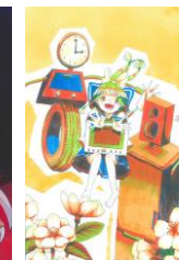
上高野由梨ちゃんと その仲間(梨・焼却炉) 作:山