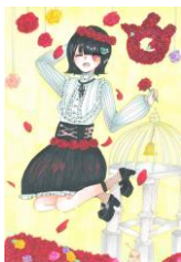
緋扇(ヒオウギ)ちゃん (京成バラ園)