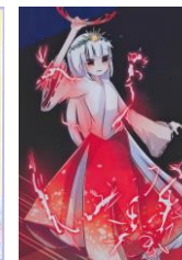
天 細葉(あめのうずは) (村上の神楽) 作:みるこ