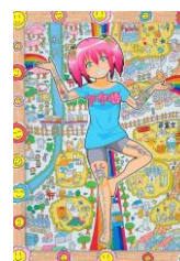
下市場梨架(国道16号・296号 下市場交差点)作:うさ美ちゃん プロジェクト