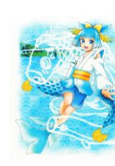
新川のぼり(ゆらゆら橋・ こいのぼり)作:みけちこ