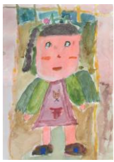
ミバラ(バラ) 作:岩崎優愛