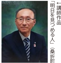
←講師作品 「明日を見つめる人」(桑折町長)